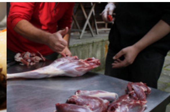
Wildfleisch vom Jäger