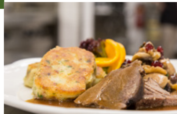
Wild-Menü im Werrapark Resort Hotel Frankenblick

Sa & So 12.30-13 Uhr | anmelden: 036782 61467 Frauenwald | Gasthaus Waldfrieden