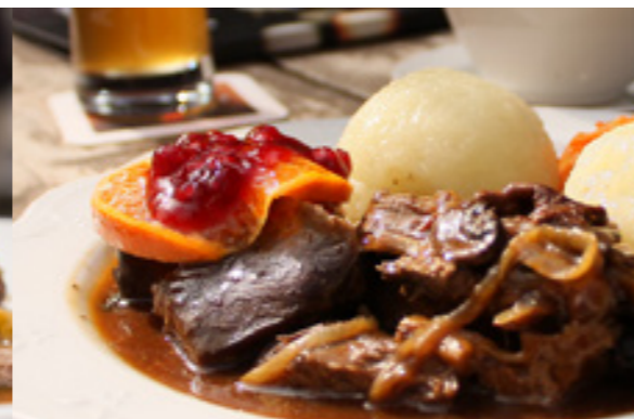
Wild-Menü im Schöffenhäuser